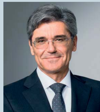
Joe Kaeser Prezidents un izpilddirektors

Siemens jau kopš dibināšanas ir iestājies par godīgumu un integritāti, inženier-tehnisko meistarību, kvalitāti un novatorismu. Šīs ir vērtības, kas līdzās ilgtspējai un atbildībai, vadīs mūsu rīcību arī turpmāk, jo tieši uzņēmuma kultūrai un vērtībām ir izšķirošā nozīme tā darbībā.